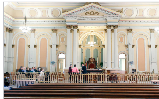
The couple married in a courthouse that seats 600. The wedding party sat in the jury box.