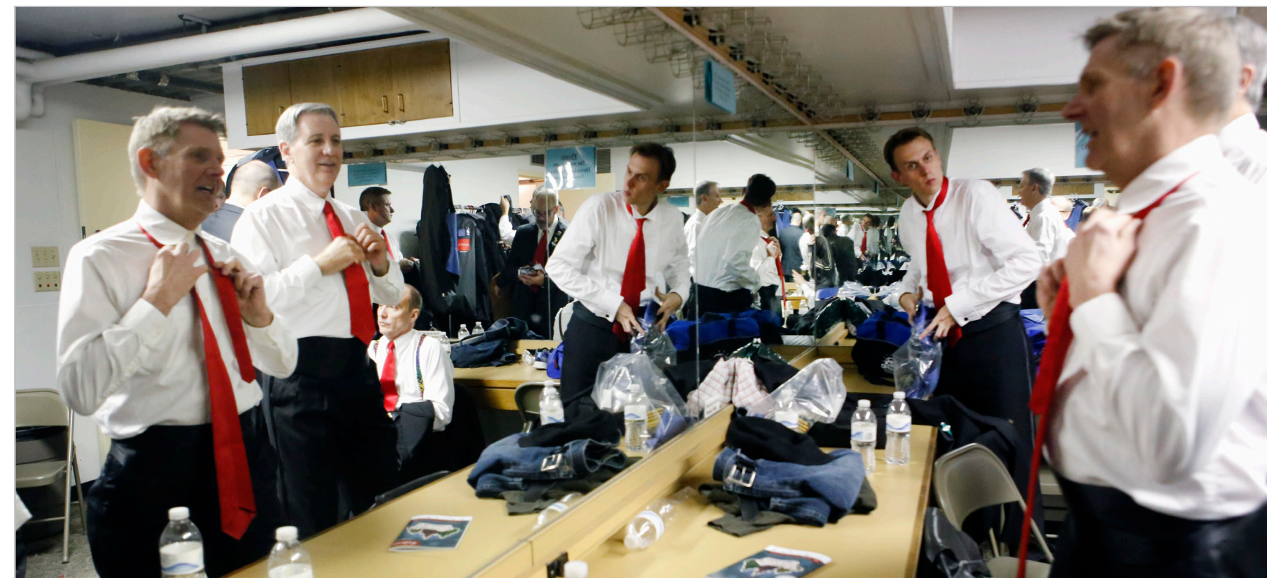
Members of the Heartland Men's Chorus switch outfits during intermission of the group's Kansas City Christmas production on Dec. 5, 2014.

etur sumquam dolorec erisit omnisse rferum essinullicae doluptum ut idunt, sunditat andebit a ni ut ad ea vellibus aligendam, quiatem fuga. Ut verciendae aestibus qui as enestistis non cum quia quibus nonsecum illaborro omnis doluptasi nimi, oditatio molupta et aut od molupta ni deles ea omnist magnati blabore ptatur, seciae