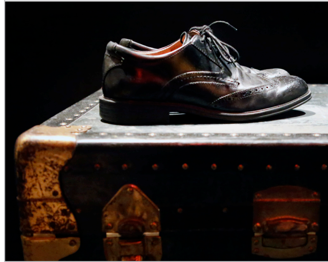
A chorus member's shoes rest on a trunk backstage prior to the opening night of the group's Kansas City Christmas production on Dec. 5, 2014.