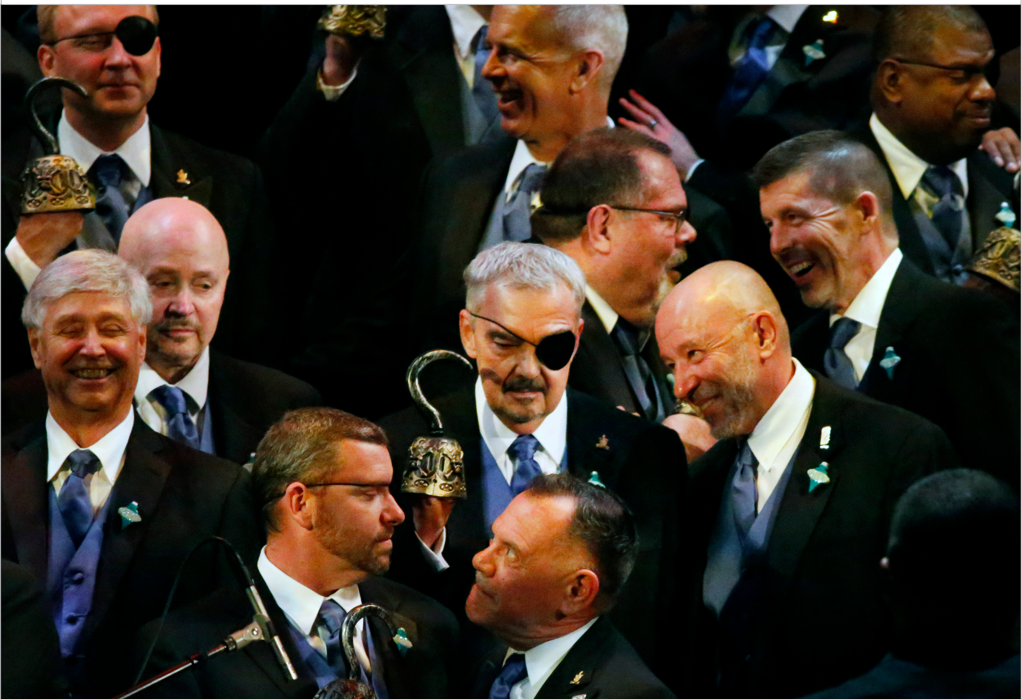
Members of the Heartland Men's Chorus break out props for the "Pirate Song" during opening night of the group's Kansas City Christmas concert.

Les veniendem quatibus dolor simet faccaer umquatur aut ipis sa sum endit peruntotam alicae vendelibus perupturem eribusandit, etur asimusaecae maximus aut hillorerio. Eptat expellautae parum autasperum, et pa nonet eum et planda a voluptur, teceati oribus. Idion coresse nihille ntiunt volliqu iatist